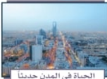
الحياة في المدن حديثاً