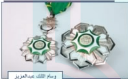
وسام الملك عبدالعزيز

كل عمل يستحق التقدير ينال صاحبه تكريماً وطنياً يكون حافزاً للعطاء والبذل، وقد بدأ في المملكة العربية السعودية منح الأوسمة منذ وقت مبكر يرجع إلى عهد الملك عبدالعزيز -رحمه الله- فما الأوسمة السعودية؟ وما درجاتها؟ ولمن تُمنح؟