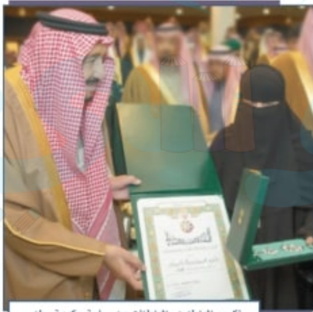
تكريم المواطنين والمواطنات من سياسة حكومة وطني

يُرشَّح الطلبة أسماء أربع شخصيات في المناطق التي يعيشون فيها ويحددون الوسام المناسب لكل شخصية حسب ما ورد في الصفحة السابقة.