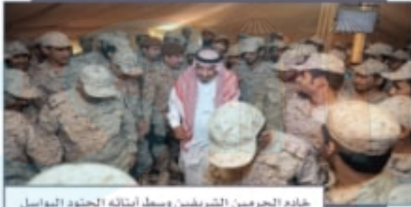
خادم الحرمين الشريفين وسط أبنائه الجنود البواسل

اليوم الوطني مناسبة يشترك فيها المواطنون، والمقيمون، والأجهزة الحكومية، والقطاع الخاص، وتتنوع الفعاليات من حيث المضمون والمكان، وهي فرصة ليشترك الجميع فيها، وهناك أسباب كثيرة تدعونا للاحتفال باليوم الوطني، منها: