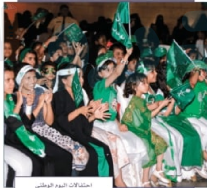
احتفالات اليوم الوطني