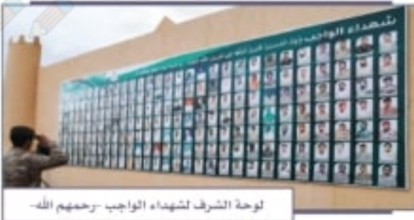
لوحة الشرف لشهداء الواجب -رحمهم الله-

◆ تقدير الجهود التي قام بها المؤسس الملك عبدالعزيز بن عبدالرحمن آل سعود - طيّب الله ثراه - ورجاله المخلصون، وأبناؤه البررة من بعده، في توحيد المملكة العربية السعودية وتأسيسها وبنائها.