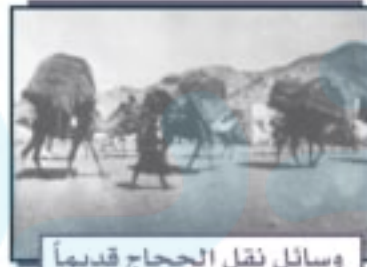
وسائل نقل الحجاج قديماً