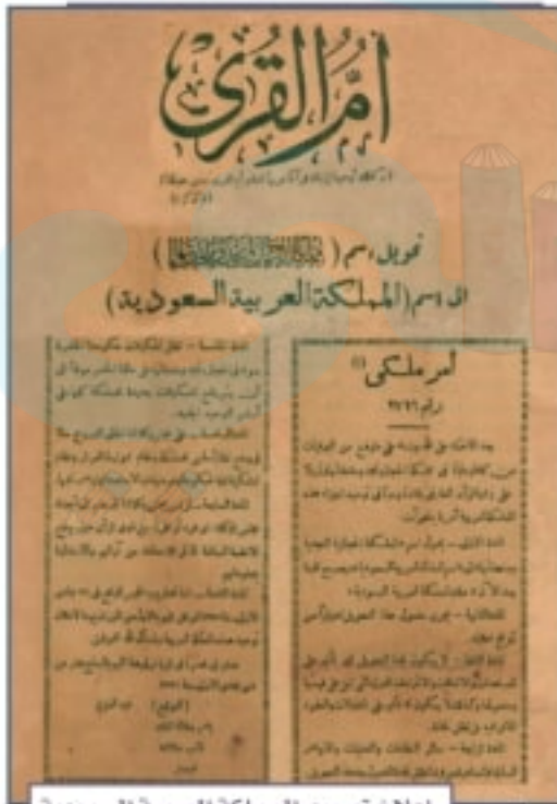
إعلان توحيد المملكة العربية السعودية

تحتفل المملكة العربية السعودية باليوم الوطني لتوحيدها في ٢٣ سبتمبر (الأول من الميزان) من كل عام، وهذا التاريخ يرجع إلى المرسوم الملكي الذي أصدره الملك عبدالعزيز بن عبدالرحمن آل سعود عند إعلان توحيد البلاد باسم المملكة العربية السعودية عام ١٣٥١هـ. وأصبحت مناسبة اليوم الوطني موعداً سنوياً للمواطنين للاحتفاء بما تحققت من وحدة البلاد وإنجازاتها والفخر بذلك.