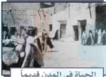
الحياة في المدن قديماً