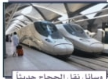
وسائل نقل الحجاج حديثاً